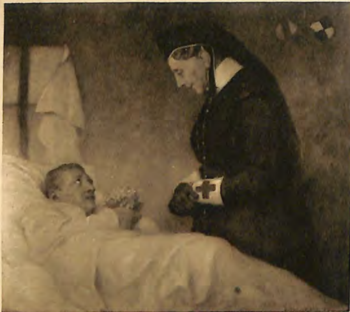
GROSSHERZOGIN LUISE VON BADEN IM LAZARETT