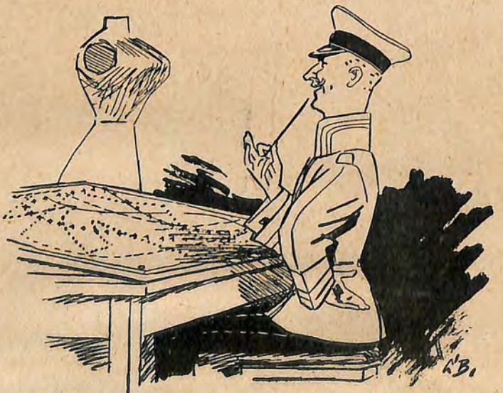
Der Generalstäbler für Schnittmusterbogen: Abt. Blumen.

(Nach Mitteilung des „Konfektionärs“ machte die Militärverwaltung bekannt, daß sie für eine einfachere Damenmode für den Herbst und Winter sorgen werde.)