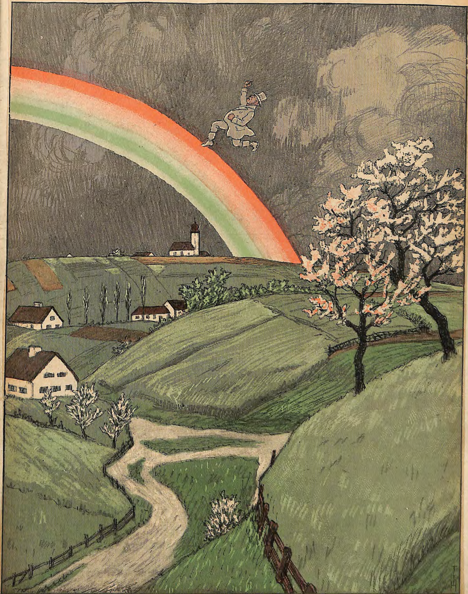
Ein englischer Gesandter begibt sich in den Himmel, um Protest gegen die deutschen Ernteaussichten einzulegen.