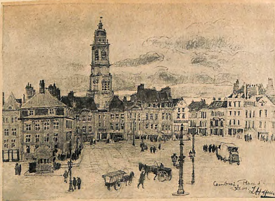
Cambrai, Place des armes

Cambrai, Place des armes L. Hefner (im Felde)