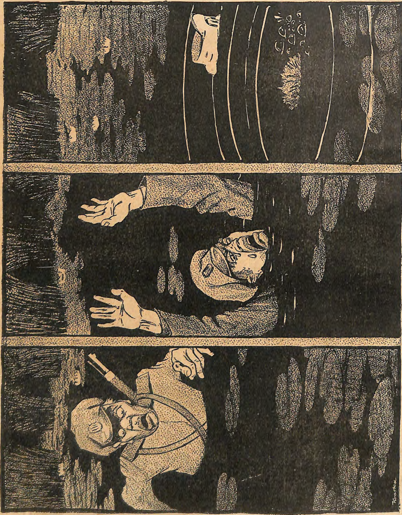
Reuter-Bericht: Russlands Lage ist gut —