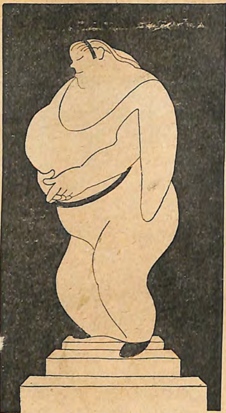
Miss Mabel als Genius des Beefsteaks, der eine glänzende Zukunft verspricht.