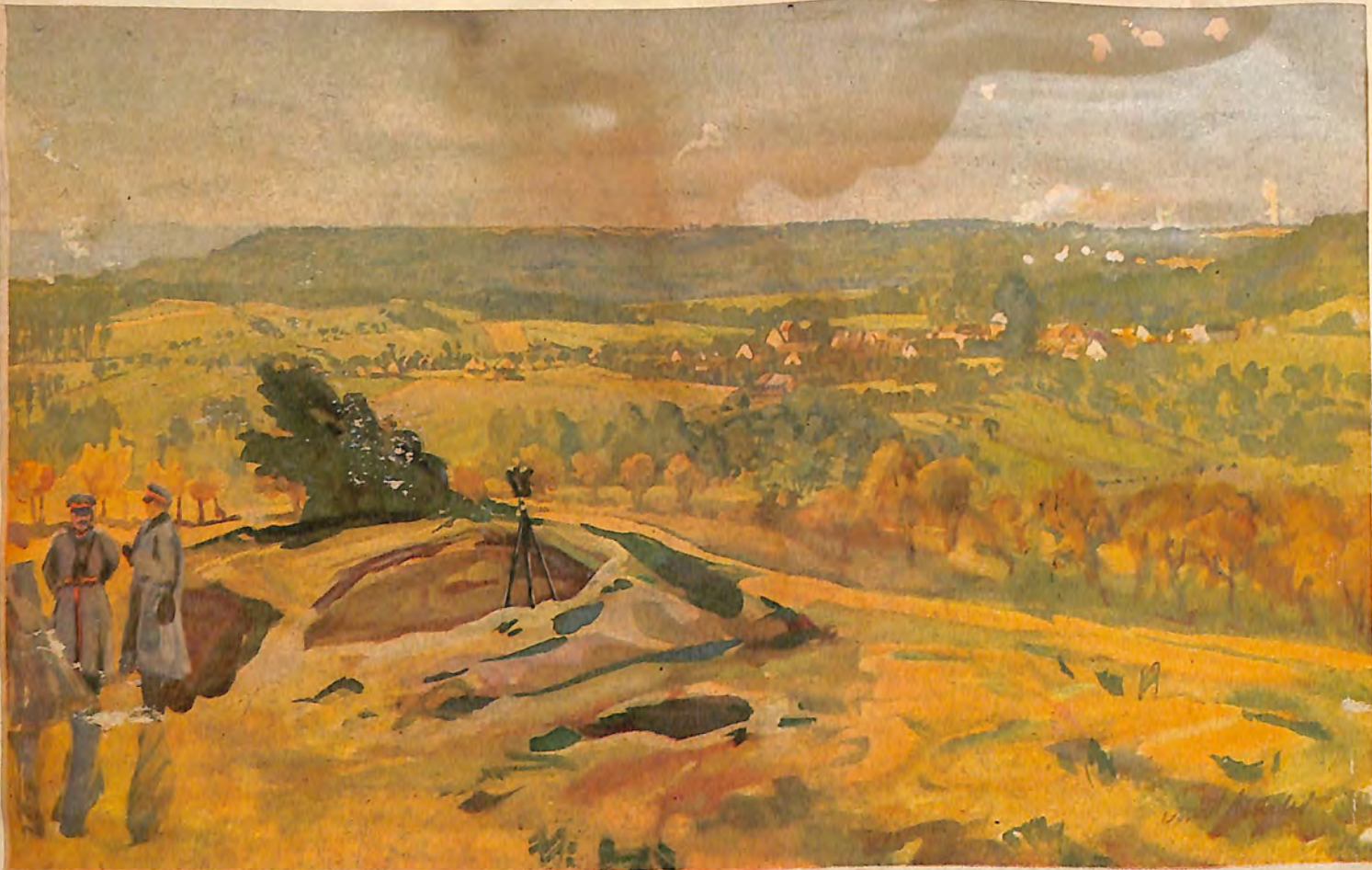
Beobachtungsposten bei Maison rouge