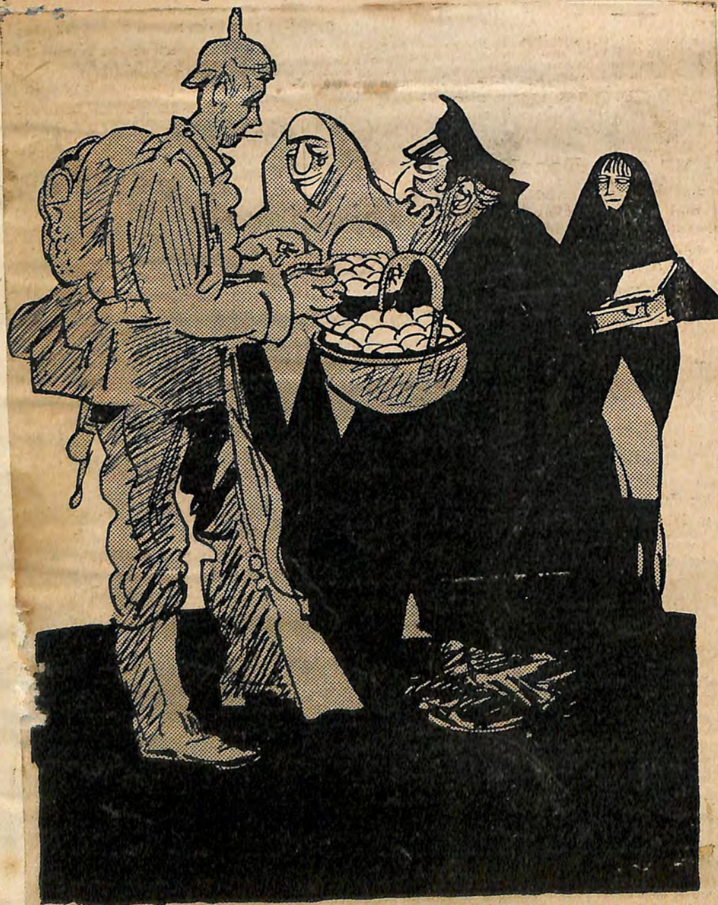
Ernst Vollbehr (Kriegsmaler im Felde)