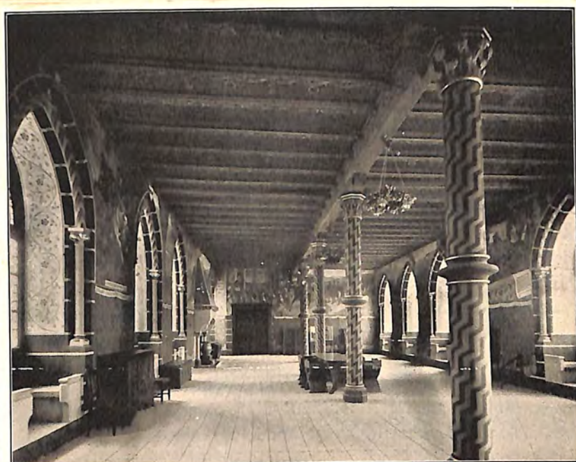
Abb. 27. Der Ritteraal.