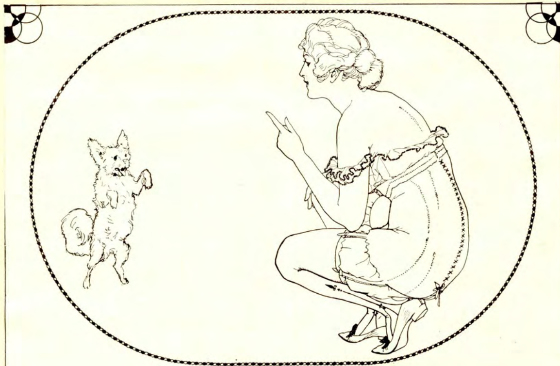
“La femme est faite pour être vêtue selon les sinuosités de ses lignes.”—Essays of Montaigne.

geben einige Proben „Robe“, deren „Façon“ die „Kleinheit“ was im Dammenden geistig.