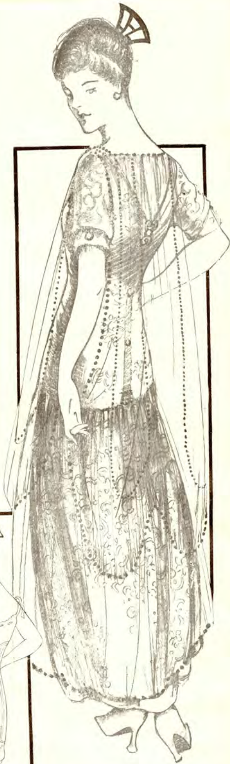
GOWN by MME. BAILEY CHICAGO