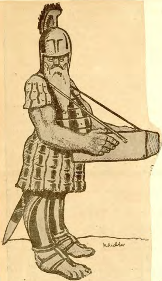
Der alte Mars: „Kriegsschauplätzchen gefällig?“