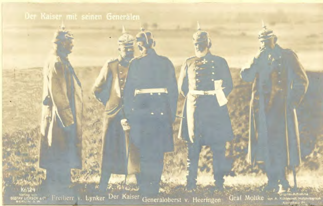
Der Kaiser mit seinen Generälen

Kr. 124 Verlag von GUSTAV LIEPSCHE & CO. BERLIN, S. W.