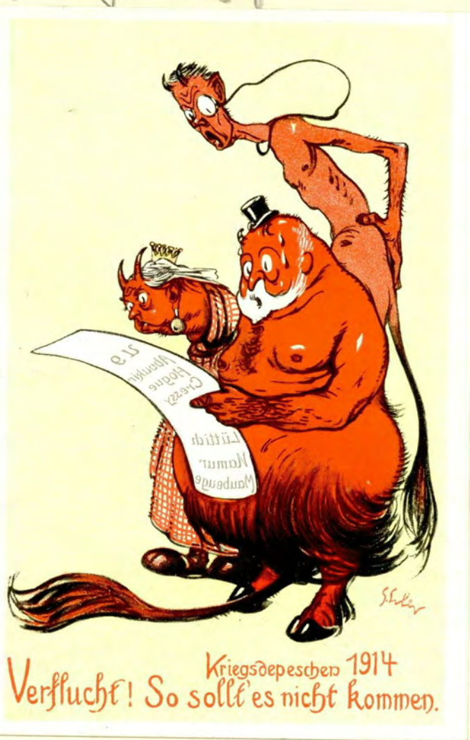
Verflucht! So sollt es nicht kommen. Kriegsdepeschen 1914

Die ant. Nachrichten vom Dingen berichten: „Auf der Seite griffen wird. Niemand ist in östl. Ufern mindere erfolgreich fortgesetzt. Im Argonnenwald waren unsere Truppen unserer Blutzünder in. Hitzgründe, Wunden. Versuchen griffen die Franzosen sehr erfolgreich an. Im Übrigen ist die Nacht in. Abends auf dem östl. Ostteil der Insel die Lage unverändert.“ Mit gespannter Aufmerksamkeit punktiert fortsetzen nicht für die auf die Abzweigung im Rheinischen Markt in auf dem ant. geographischen Breitenkreis. Wobei der Abzweigung der Fische heißt die Times: In Fische sahen die Fische nicht im ant. Breiten, die in ant. = und Götter get in. In Fische nicht im ant. Breiten, die in ant. =