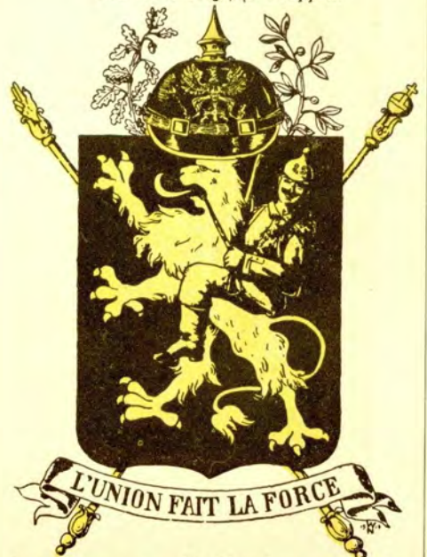
Zur Erinnerung an die Einnahme von Belgien, August 1914